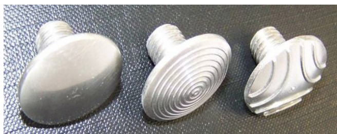
vue en plan Ø 25 mm